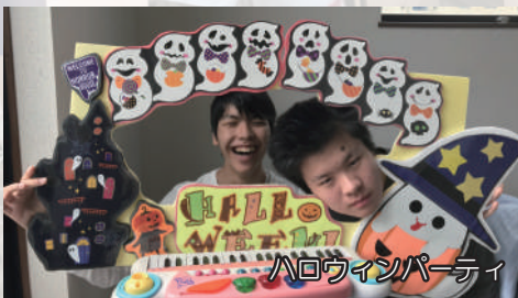
ハロウィンパーティ