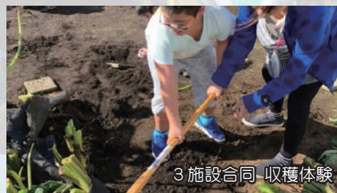
3施設合同収穫体験