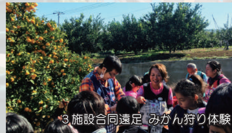
3施設合同遠足 みかん狩り体験