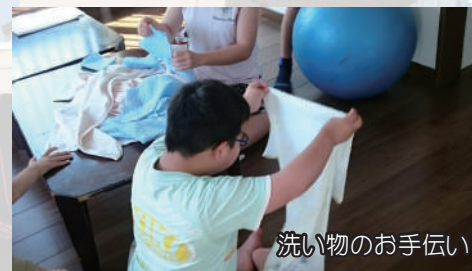
洗い物のお手伝い