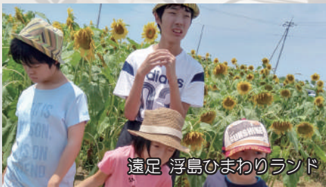
遠足 浮島ひまわりランド