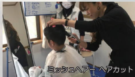
ミツシユヘアーヘアカット