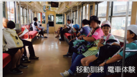
移動訓練 電車体験