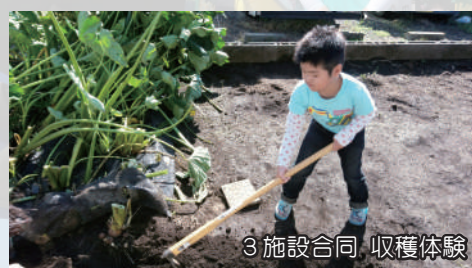
3施設合同 収穫体験