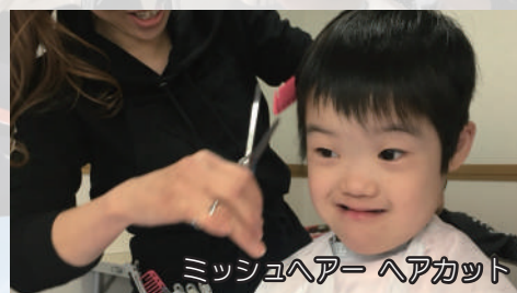
ミッシュヘアー ヘアカット