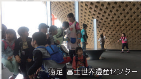
遠足 富士世界遺産センター