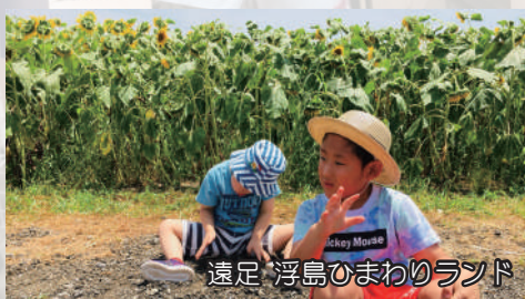
遠足 浮島ひまわりランド