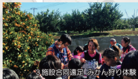
3施設合同遠足 みかん狩り体験