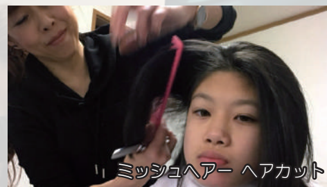
1 ミッシェルヘア ヘアカット