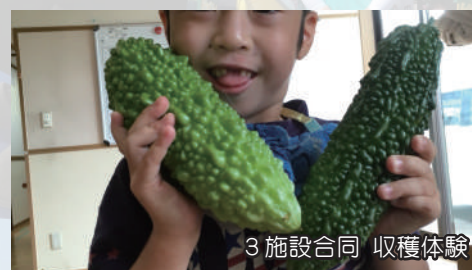
3施設合同 収穫体験